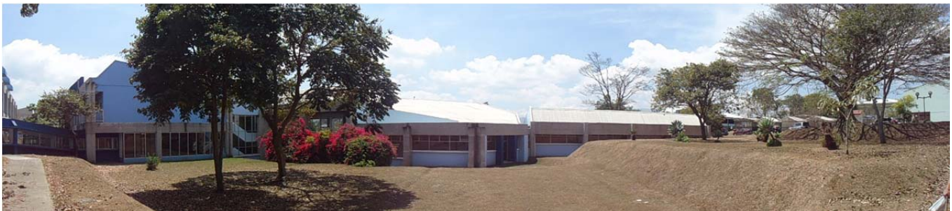
Foto 4. Sitio donde se va desarrollar el Edificio de Centro de Investigaciones en Neurociencias (CIN), se presenta en zona plana, sus inmediaciones se presentan intervenidas.

Foto 3. Sitio donde se va desarrollar el Edificio de Centro de Investigaciones en Ciencia e Ingeniería de Materiales (CICIMA/Nanociencias) tiene una topografía plana con cobertura de zacate.