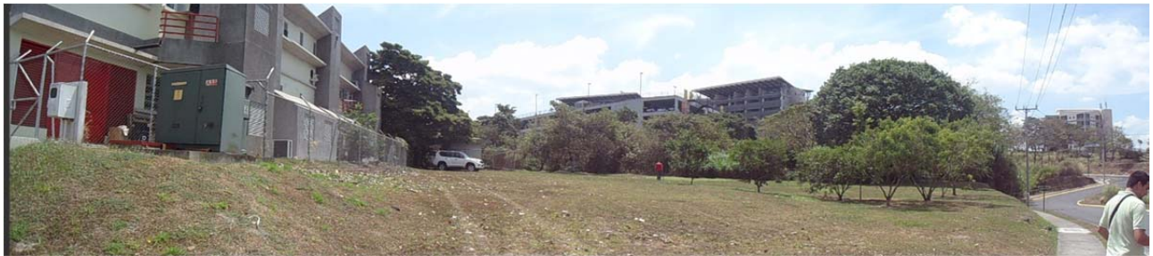
Foto 1. Zonas verdes ubicadas en la margen derecha de la quebrada, a la izquierda se observa que la zona ha sido ya intervenida, presenta una cobertura vegetal con zacate y árboles, topografía plana, se va desarrollar el edificio de parqueos.

Los accesos son por calles asfaltadas que comunican San Pedro con la provincia de San José, además de los otros distritos de Montes de Oca, Guadalupe y Zapote, al oeste colinda con la carretera de circunvalación, las cuales son transitables durante todo el año en cualquier tipo de vehículo (Figura 1, Mapa de Ubicación).