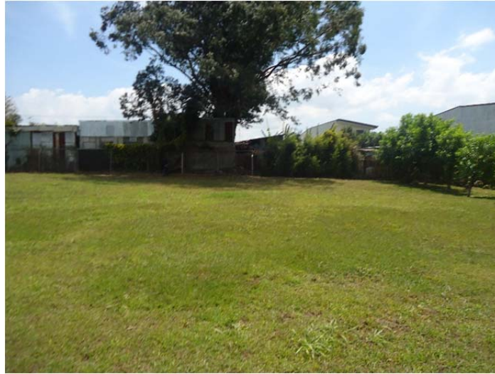
Foto 3. Sitio donde se va desarrollar el Edificio de Centro de Investigaciones en Ciencia e Ingeniería de Materiales (CICIMA/Nanociencias) tiene una topografía plana con cobertura de zacate.

Foto 2. Condiciones de bajo caudal de la Quebrada, en el momento de la visita, dicho cauce tiene 1 a 2 m de ancho y su profundidad es variable.